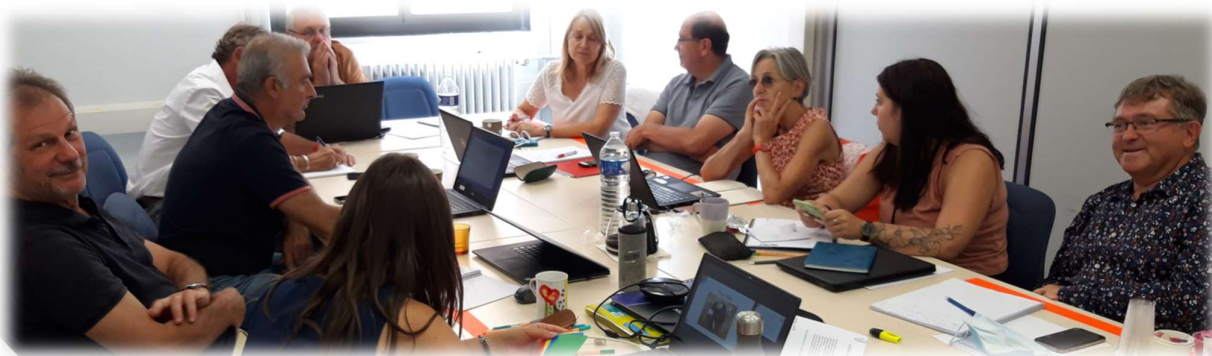
Des experts en formation approfondie au siège régional d'Energie Jeunes

Cette fonction d'expert est très importante pour Energie Jeunes car c'est elle qui assure en particulier la qualité de nos prestations en collèges.