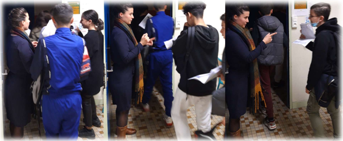
Collège Emile Malfroy, Grigny Contrôle des défis, en sortie de classe, après l'épisode 2

La posture de l'enseignant et la cohérence des discours, sous forme de regards croisés, permet de convaincre les élèves et favorise le déclenchement de déclics salvateurs.